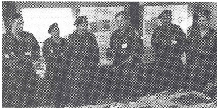
NATO Partnership for Peace training exercises. Тренувальні вправи програми НАТО „Партнерство для миру“.