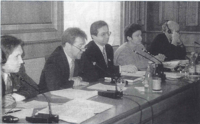
Посол Канади в Україні Крістофер Вестдал бере участь у семінарі, присвяченому реформі судової справи в Україні

нагороду на церемонії надання першої Всеукраїнської премії „Прометей-Престиж“ за найвищі професійні і громадські досягнення. Посол, який виголосив промову українською мовою, вручив премію у категорії „Гордість нації“.